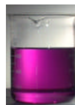
Rys 2.: Oryginalny fioletowy kolor oznacza, że w linii piwnej nie ma już zanieczyszczeń mikrobiologicznych