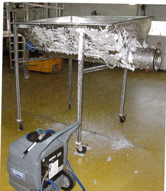
Reinigung von Oberflächen mittels Schaumreiniger

In letzter Zeit werden verstärkt Reinigungsmittel und -systeme auf Schaumbasis angewandt. Hierbei werden mittels Druckluft und Schaumlanze die Reinigungsmittel verarbeitet. Es bildet sich ein stabiler, fester Schaum, der auch auf senk-